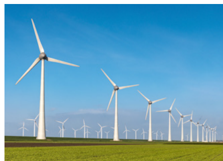
Windkraft von der Oekostrom AG