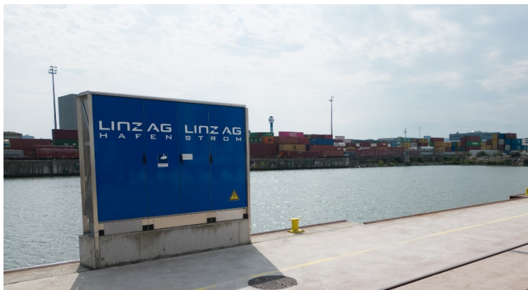
Abb. links und unten Symbolbilder Ener- gieterminal mit Landstroman- schlüssen Aufgenommen im LINZ AG HAFEN.

Die geplanten Anlagen an den Anlegestellen der Donauländen werden niedriger und dafür etwas breiter als die Anlagen im Hafen sein.