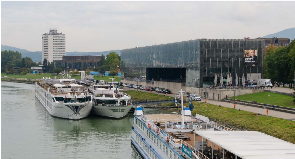
Abb.: Die geplanten Energieterminals können auch zwei hintereinanderliegende Kreuzfahrtschiffe an der Anlegestelle mit Strom versorgen.

Die Versorgung der Kabinenschiffe mit Landstrom erfordert neben der Errichtung von Energieterminals zum Anschluss der Schiffe direkt auf den in Linz sieben Anlegestellen (Pontons) auch den Bau von entsprechenden Trafostationen in der Nähe der Anlegestellen. In Linz werden fünf Trafostationen benötigt und gebaut.