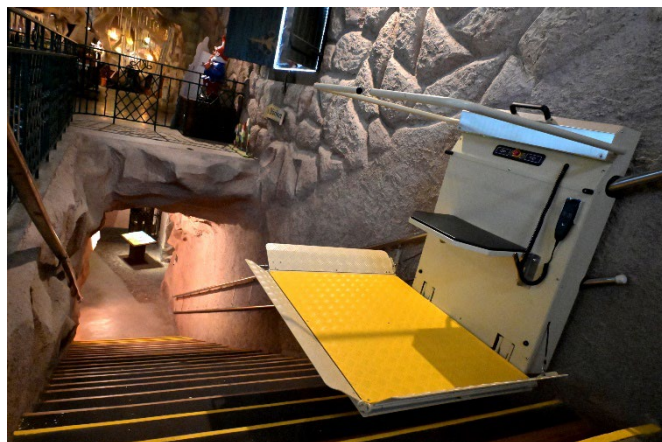
Der neue Treppenlift bringt in puncto Barrierefreiheit zusätzlichen Komfort.

Ein besonderer Schwerpunkt der Winterarbeiten wurde dem Thema Barrierefreiheit gewidmet. Die Grottenbahn war auch bisher schon barrierefrei zugänglich, nun wurden aber weitere Möglichkeiten genutzt, um noch bedarfsgerechter werden. So wurde ein neuer Treppenlift angeschafft, der über eine größere Abstellfläche (für Rollstühle, Gehhilfen o.Ä.) und eine höhere Maximalkapazität von 300 kg verfügt. Für gebrechliche Personen verfügt der neue Treppenlift auch über einen Klappsitz, sodass der Weg vom Drachenzug im Erdgeschoß zum Märchenhauptplatz im Untergeschoß problemlos und komfortabel zurückgelegt werden kann. Zudem ist der neue Treppenlift mit zahlreichen Sicherheitssensoren und einer farblich markierten Stellfläche ausgestattet, sodass die optimalen Voraussetzungen für einen entspannten Besuch und ein bezauberndes Erlebnis in der Grottenbahn gegeben sind.