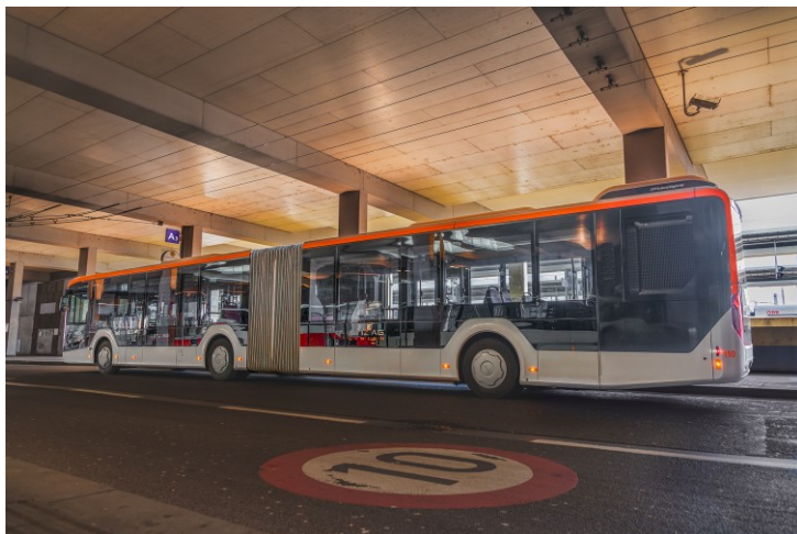
Bildtext: Die neue Schnellverbindung nutzt die Haltestelle Hauptbahnhof Terminal Steig A3

Während die bestehende Schnellbuslinie 72 über den „Hauptbahnhof-Kärntnerstraße“ verläuft, beginnt der neue Direktkurs 72* an der Haltestelle Hauptbahnhof Terminal Steig A3 . Dies bringt Vorteile für die einpendelnden Fahrgäste. Die Einstiegstelle Terminal Steig A3 ist auf kurzem Weg von den jeweiligen Ankunftsbahnsteigen zu erreichen. Der Fahrplan ist weitestgehend an relevante Ankunfts- bzw. Abfahrtszeiten (LILo, S-Bahnen, Regionalverkehr, ÖBB, Westbahn) angepasst.