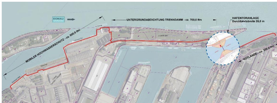
Abbildung (v.l.): ca. 900 lfm (Laufmeter) mobiler Hochwasserschutz, Ertüchtigung des bestehenden Hochwasserschutzdammes = Untergrundabdichtung Trenndamm (ca. 700 lfm), Hochwasserschutztor = Hafentoranlage (Durchfahrtsbreite 26 m) – Notlände ca. 300 lfm.

Ab Gesamtfertigstellung im Sommer 2025 schützen diese Maßnahmen den Linzer Handelshafen, die Betriebe der Firmen Plasser & Theurer und ÖSWAG sowie das rundum angrenzende Industriegebiet vor einem 300-jährigen Hochwasser. Das Projekt wird national vom Bundesministerium für Klimaschutz (BMK) und vom Land Oberösterreich sowie von der EU gefördert. Das Hochwasserschutzprojekt ist auch Teil der großen Linzer Hafentransformation. Um die Zukunft des Hafen-Standortes abzusichern, hat die LINZ AG im Jahr 2014 einen Masterplan mit Investitionen in die Transport- und Logistikinfrastruktur präsentiert und darauf aufbauend das „Projekt Neuland“ ins Leben gerufen. Die Transformation erlebte im September 2023 mit der Eröffnung im 18 Meter hohen Hafenpark einen spektakulären Höhepunkt.