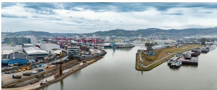
Bildtext: Das Projekt schützt den Linzer Hafen mit einer Fläche von 130 ha und das angrenzende Industriegebiet bis zum Innenstadtviertel. Der Spatenstich für das Jahrhundertprojekt erfolgte im Februar 2024.

Die geplanten Hochwasserschutzmaßnahmen umfassen den Einbau eines Hochwasserschutztors (Hafentoranlage) sowie die Errichtung einer Notlande (beides im Bereich der Einfahrt in den Linzer Handelshafen), die Ertüchtigung des bestehenden Hochwasserschutzdammes im Bereich Handelshafeneinfahrt bis Einfahrt Winterhafen sowie die Montage eines mobilen Hochwasserschutzes im Bereich des Schiffswerft-Areals im Winterhafen.