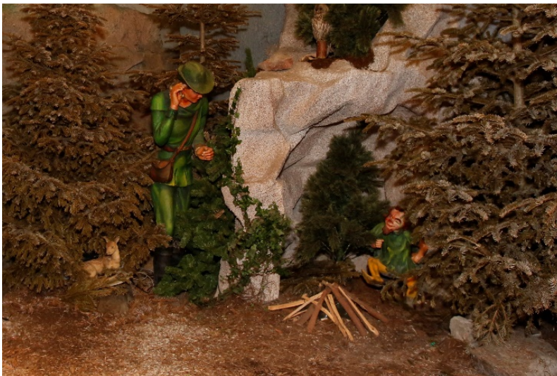
Der Jäger des Rumpelstilzchens wurde ausgebessert.

Um das einzigartige Erscheinungsbild der Märchengruppen zu erhalten, sind immer wieder Überarbeitungen notwendig. In einer Seitengasse des detailgetreu nachgebauten Hauptplatzes finden die Besucher die Märchengruppe des Rumpelstilzchens. Der Jäger durfte sich über einen neuen Anstrich freuen und erstrahlt jetzt wieder in neuem Glanz.