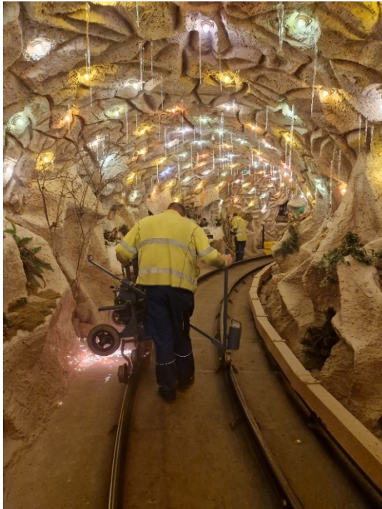
Schienenschleifen in der Drachenbahn.

Damit Lenzibald weiterhin ruhig seine Runden drehen kann und die Besu-