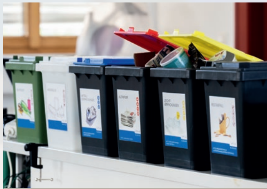
„Müllis“ für kleinere Mengen (10 Liter Volumen)

Für Leichtverpackungen, Altpapier, Metallverpackungen sowie Bunt- und Weißglas empfehlen wir beispielsweise stapelbare Trennsysteme oder sogenannte „Müllis“.