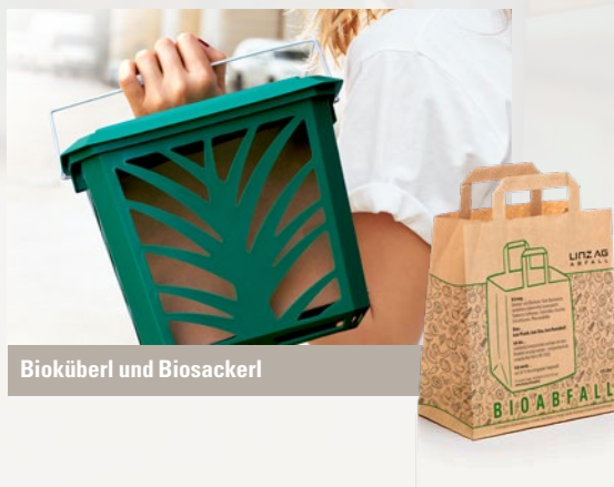
Bioküberl und Biosackerl

LINZ AG ABFALL bietet kostenlose Aufkleber zur Kennzeichnung der Trennsysteme sowie Bildtrennanleitungen im Format A1 oder A2 an.