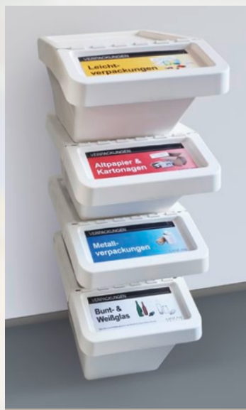
Trennsystem aus Kunststoffbehälter (35 bis 60 Liter Volumen)

Behälter aus Kunststoff sind durch die Schulen selbst anzuschaffen.