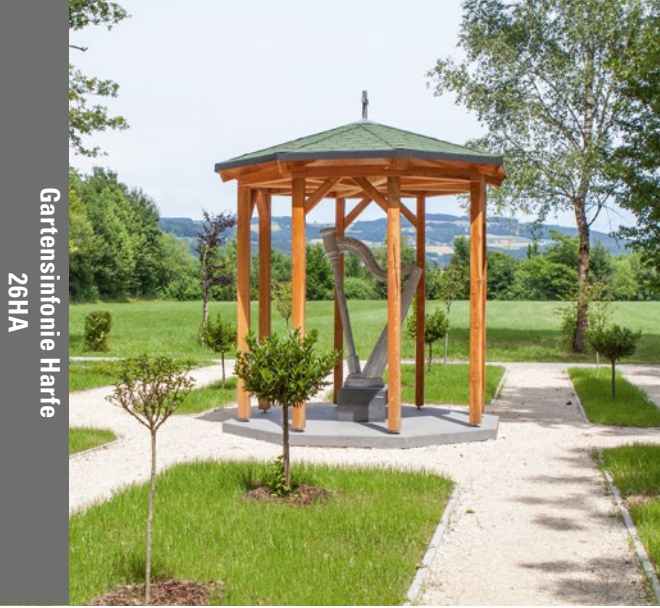
Gartensinfonie Harfe 26HA