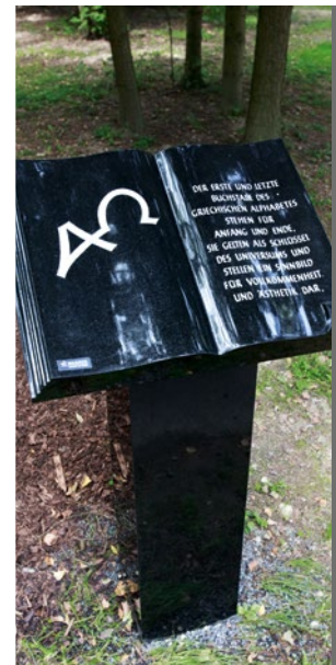
Alpha Omega 20AQ