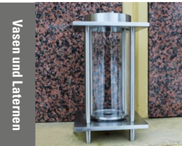
Vasen und Laternen