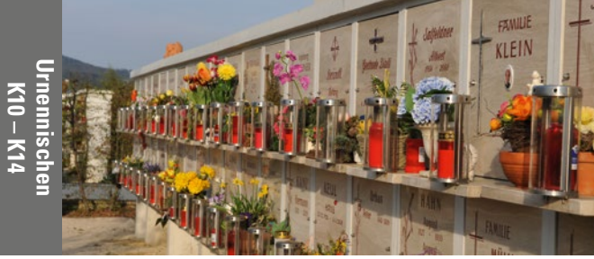
Urnensischen K10 – K14